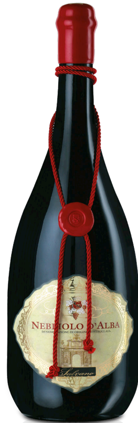
GOBBO NEBBIOLO D'ALBA 2019 LT.5