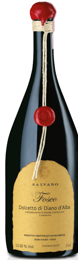
JEROBOAM DIANO D'ALBA SUPERIORE 2021 FOSCO LT. 3