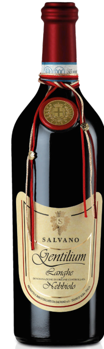
MAGNUM LANGHE NEBBIOLO 2020 GENTILIUM LT. 1,5